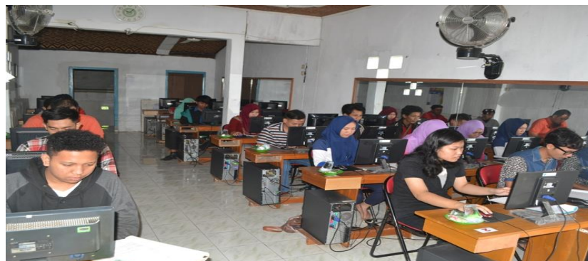
Gambar 1. Foto Kegiatan Pelatihan

Berdasarkan fenomena tersebut, maka diadakan Pelatihan tentang teknopreneur, harapannya bisa menumbuhkan semangat berwirausaha para peserta Kursus Di LKP Lestari Komputer Slawi