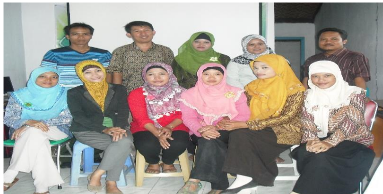
Gambar 4. Foto Bersama