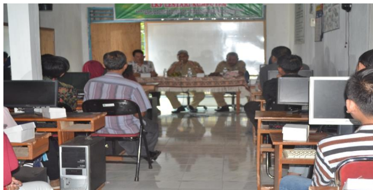
Gambar 3. Sosialisasi

teknopreneur khususnya penjualan online melalui e-commerce , dimulai dari memulai usaha, pengenalan google bisnis, pengenalan situs WEB, pemasaran konten dan cara mendirikan toko online shop. Pelaksanaan kegiatan Pengabdian Kepada Masyarakat berjalan dengan lancar dan mendapat sambutan hangat baik pimpinan LKP Lestari Komputer dan instruktur komputer maupun peserta pelatihan dan bahkan diminta oleh peserta untuk dilanjutkan kegiatan bimbingan ini terutama praktek cara pendampingan baik secara offline maupun online.